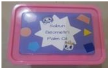
Gambar 1. Media Sabun Geometri

Media pembelajaran merupakan alat untuk mencapai tujuan pembelajaran, penggunaan media yang tepat dapat mempermudah guru dalam mengajar dan menghasilkan minat anak pada proses pembelajaran dan penerimaan informasi (Siregar et al., 2022). Media pembelajaran adalah wujud instrument yang bisa dimanfaatkan sebagai penyampai pesan atau perantara aktivitas belajar (KBBI). Media sabun geometri palm oil adalah sebuah media alternatif pengenalan geometri untuk anak usia 5-6 tahun untuk meningkatkan kemampuan kognitif anak dimana didalamnya merupakan kegiatan membuat sabun sendiri disini anak diberikan pengalaman untuk membuat sabun sendiri dari bahan yang ada disekitar mereka 24 hari-hari, yaitu palm oil atau minyak kelapa sawit. bentuk media sabun geometri palm oil ditunjukkan pada gambar 1 dan 2.