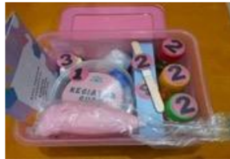
Gambar 2. Isi Media Sabun

Media sabun geometri palm oil ini di desain untuk menciptakan karya berupa sabun berbentuk geometri sehingga memberikan antusiasme dan pengalaman secara langsung yang ditujukan untuk mengembangkan kognitif anak usia 5-6 tahun. Media sabun geometri ini berbentuk box di dalamnya berupa beberapa jenis minyak, cetakan, stik, sarung tangan, buku panduan. Media sabun geometri adalah kegiatan untuk membuat sabun yang mana anak dapat belajar mencampur minyak, mengaduk, mewarnai dan mendapatkan pengalaman untuk membuat sabun berbentuk geometri, tentu proses kegiatan selalu dalam pengawasan guru atau orang dewasa agar tujuan dari media pembelajaran ini tercapai.