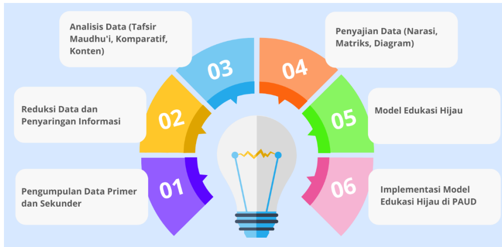
Gambar 2. Proses Penelitian

David Silverman menekankan pentingnya validitas dalam penelitian kualitatif melalui triangulasi dan peer review (Silverman, 2013). Untuk memperkuat validitas penelitian, dilakukan triangulasi sumber data dan metode analisis. Hasil analisis akan disajikan dalam bentuk narasi analitis yang didukung tabel matriks kesesuaian nilai Al-Qur'an dengan SDGs, diagram alur implementasi, dan panduan praktis penerapan model di PAUD.