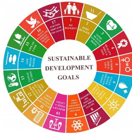
Gambar 1. Sustainable Development Goals (Authority, 2024)

Pendidikan anak usia dini (PAUD) merupakan fase kritis dalam pembentukan karakter dan kesadaran lingkungan. Pada fase emas ( golden age ) ini, anak tidak hanya mengembangkan kemampuan kognitif, tetapi juga nilai-nilai fundamental termasuk kepedulian terhadap lingkungan (Santrock, 2018). Tantangan lingkungan global seperti perubahan iklim dan kerusakan ekosistem menuntut pendekatan edukasi hijau yang ditanamkan sejak dini (IPCC, 2022). Sustainable Development Goals (SDGs) melalui tujuan pendidikan berkualitas (Goal 4) dan aksi iklim (Goal 13) telah memberikan kerangka kerja global untuk mewujudkan hal tersebut (Alisjabana & Murniningtyas, 2018).